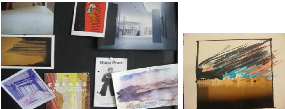
Figur 7 Søren Robert Lund var inspireret af tegneserier som TinTin og Hugo Pratt, da han tegnede ARKEN. Figur 8 Fotocolage af Søren Robert Lund fra 1988