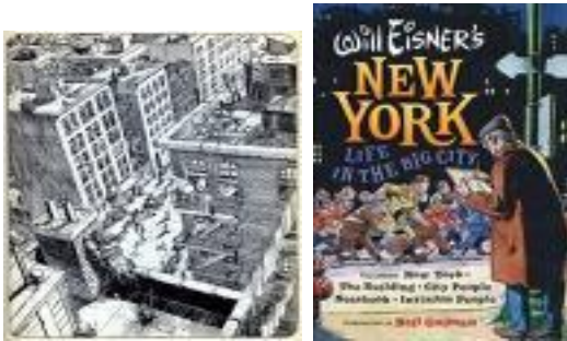
Figur 4 Tegneserie om New Yorks byliv af Will Eisner, faderen til Spirit