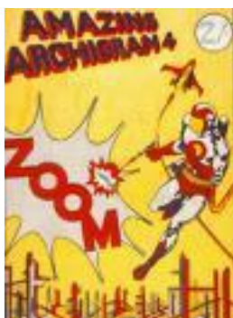
Figur 2 Den engelske tegnestue ARCHIGRAM brugte tegneserier til at præsentere nye idéer