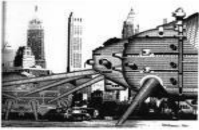
Figur 3 Arkitekt Ron Herrons (fra ARCHIGRAM) fremtidsvision "Walking city" 1964