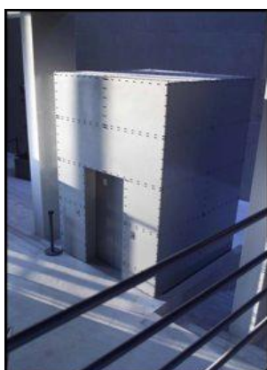
Figur 11 Det maritime udtryk ses på ARKEN ved boltene på dørene