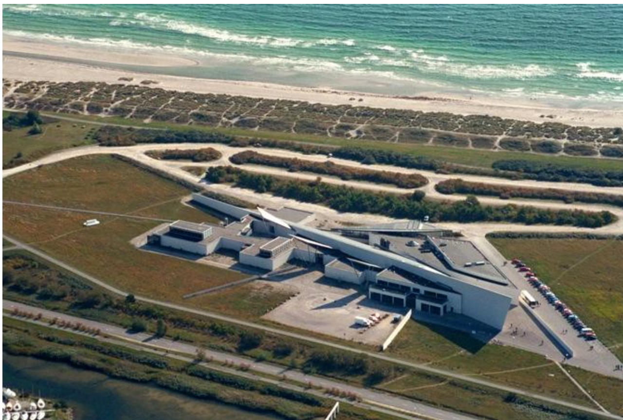
Figur 12 Luftfoto af ARKEN

På et luftfoto kan man se, hvordan strandene langs Køge Bugt er adskilt fra fastlandet ved mindre indsøer. For at komme til stranden kører man ad smalle veje. Systemet er hentet fra Holland, hvor man beskytter landet fra oversvømmelser ved at bygge diger og indsøer, hvor man kan regulere vandtilstrømningen. Det samme system bruger man langs Køge Bugt. ARKENs akser er inspireret af de rette linjer i landskabet udenfor bygningen bl.a. vejene langs digerne.