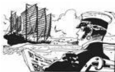
Figur 1 Corto Maltese af Hugo Pratt

Søren Robert Lund hentede meget af sin inspiration fra tegneserieuniverser som dem nedenfor. I tegneserier følger man hovedpersonernes rejse eller bevægelse igennem forskellige typer af rum. Natur og arkitektur danner rammen om handlingen. Tegneseriens univers kombinerer ofte virkelige rum med fantasifulde verdener. I tegneserien kan man realisere drømmebyggerier.