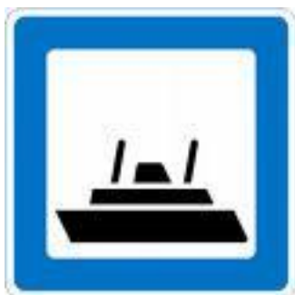
Figur 10 Færgeskilt