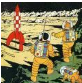
Figur 1 Tintin på månen af Hergé